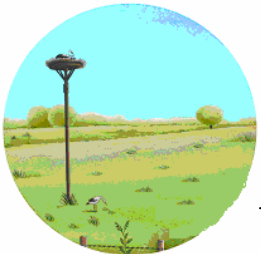
Un mât à cigognes