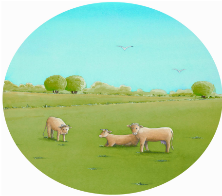
Vaches en pâturage